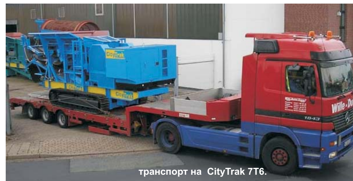
транспорт на CityTrak 7T6.