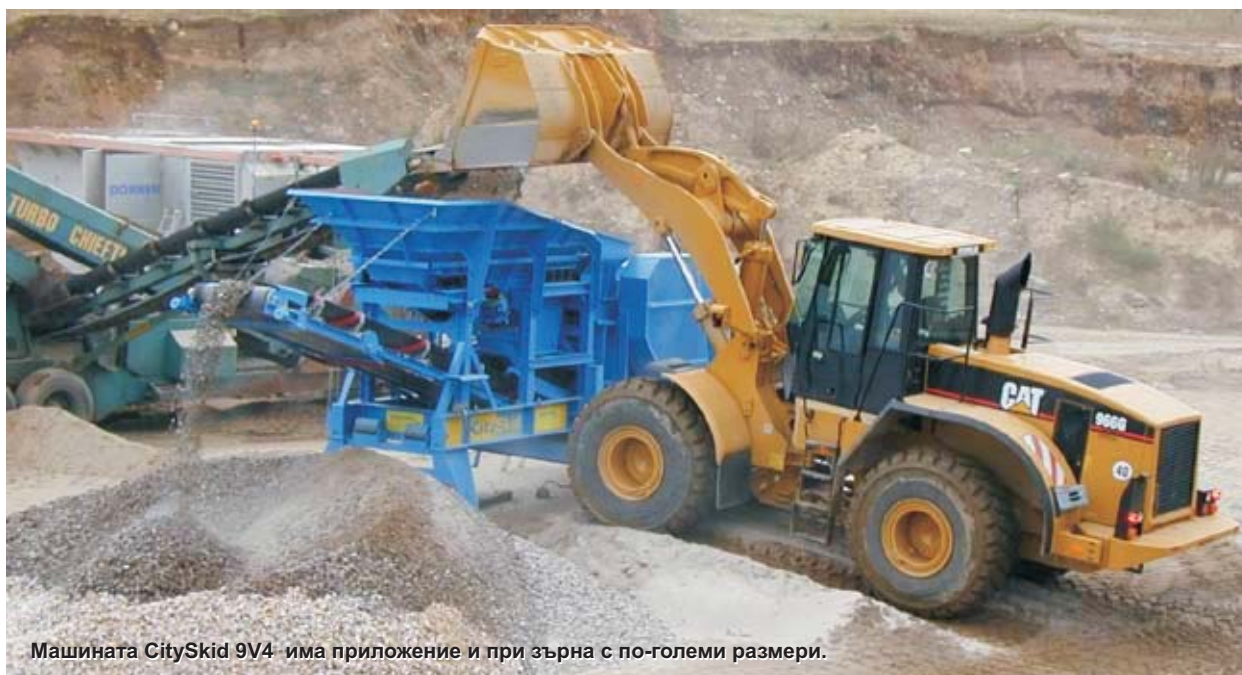
Машината CitySkid 9V4- има приложение и при зърна с по-големи размери.

250 mm. Ширината на челюстта осигурява висока производителност. Преднамерено ограниченият отвор на питателя до 250 mm допринася за равномерното разпределение и добрия размер на зърната, които продължават да се натрошават по цялата дължина на челюстта преди да се разтоварят през тесен отвор.