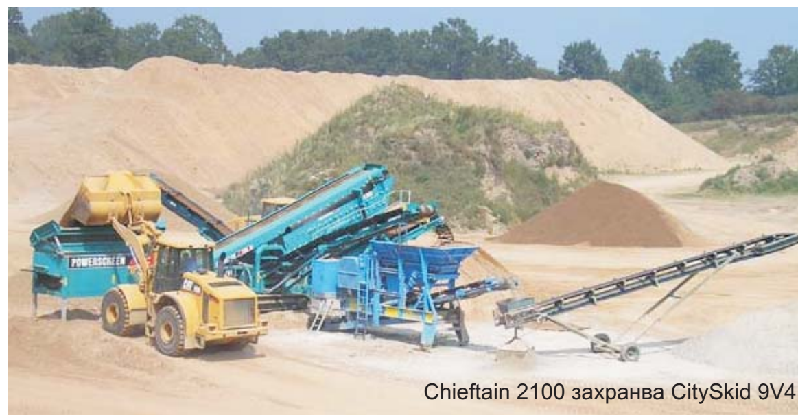
Chieftain 2100 захранва CitySkid 9V4