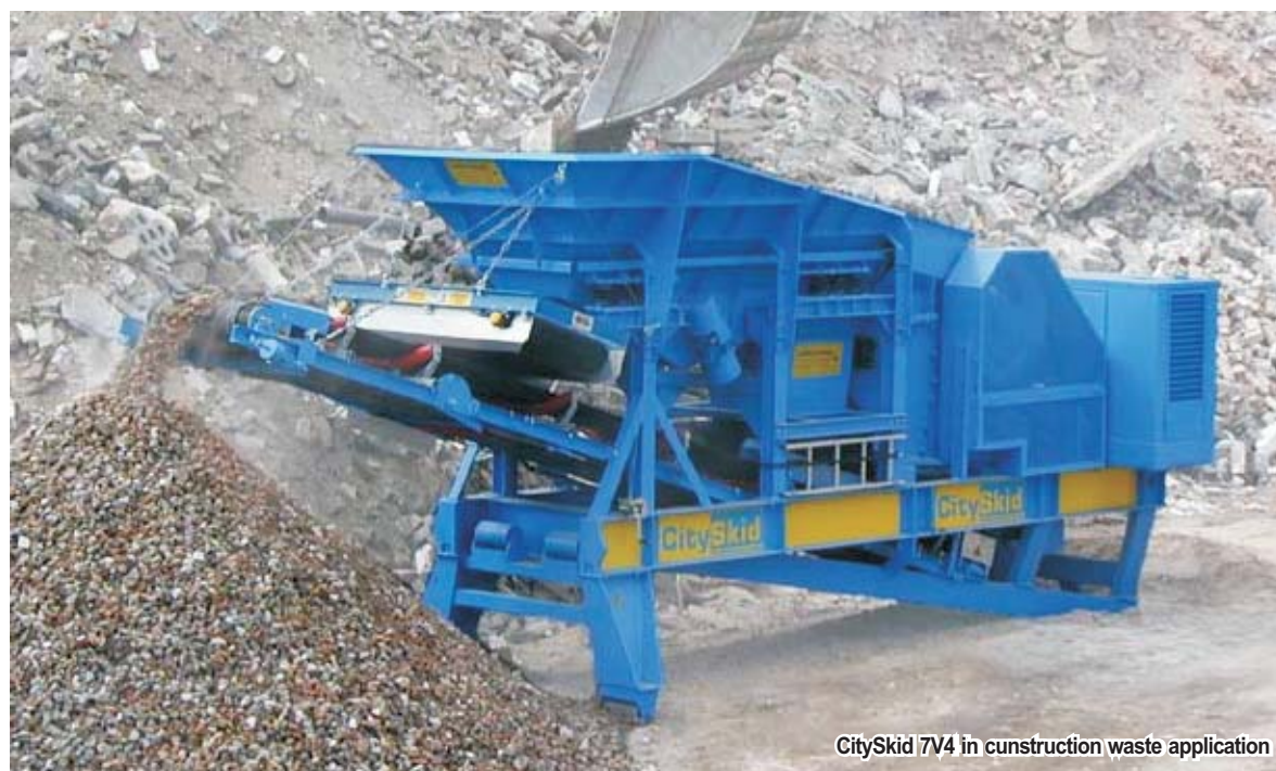
CitySkid 7V4 in construction waste application

Машината CitySkid 7V4 се е наложила на вътрешния и международния пазар в областта на рециклирането на дребнозърнест материал и природни скали. CitySkid 7V4 предлага най-добрите условия за преобразуването на едрия материал в желаната зърнена структура при ниско износване на машината.