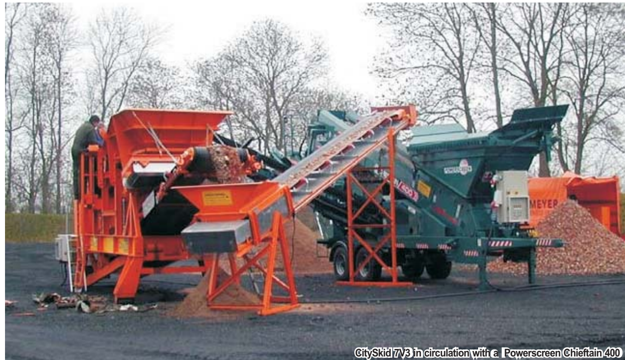
CitySkid 7V3 in circulation with a Powerscreen Chieftain 400

си по прост, но впечатляващ начин. Операторът може да оцени машината, когато види как твърде големите парчета материал, които трябва да се разтрошат, се захранват и транспортират напълно безопасно. При възникването на каквото и да е проблем, CitySkid предлага пълен достъп до критичните точки. Фактът, че подвижната челюст и разтоварващият транспортър се движат в една посока, осигурява оптималното разтоварване на желязо и минерали. Мотото на 7V3. е:” да работи без закупуването и поддръжката на дизелов двигател при наличието на външно електричество.” Легалното зареждане на инсталирания дизелов агрегат с промишлено гориво на разумна цена, вместо със скъпото дизелово гориво прави използването на полуподвижната машина 7V4 много привлекателно.