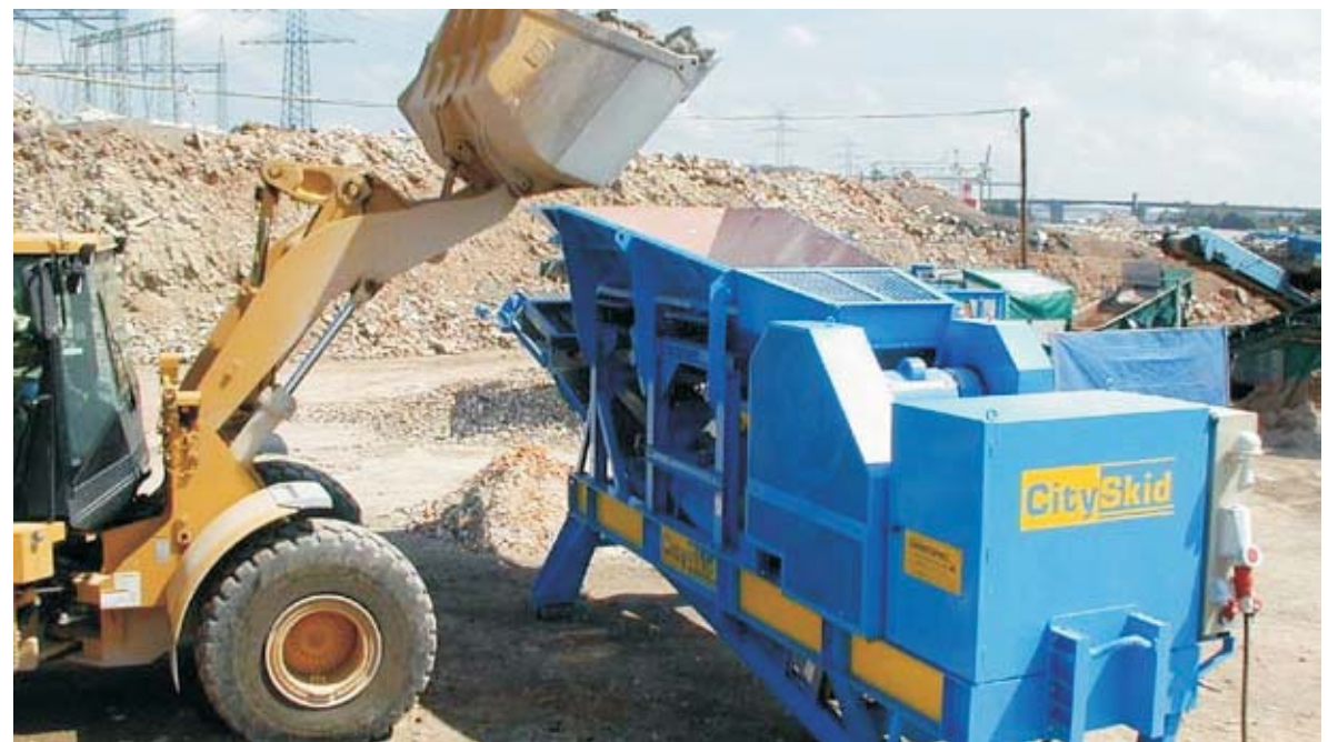
питател с колела на CitySkid 7V4